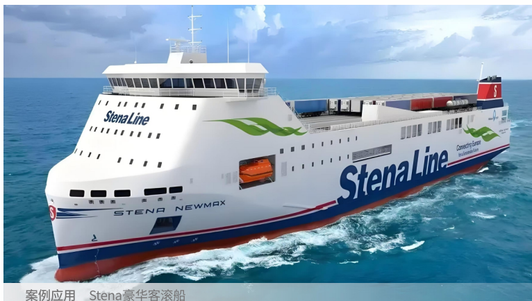
案例应用 Stena豪华客滚船